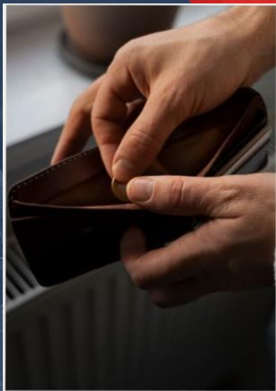
แก้ปัญหาหนี้สิน ในภาคครัวเรือน