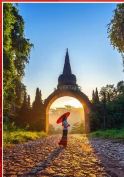
ผลักดันการ ท่องเที่ยว