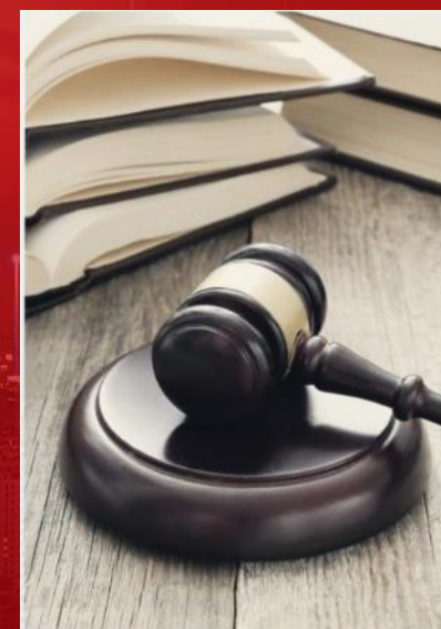
ฟื้นฟูหลักนิติธรรม ( Rule of Law )