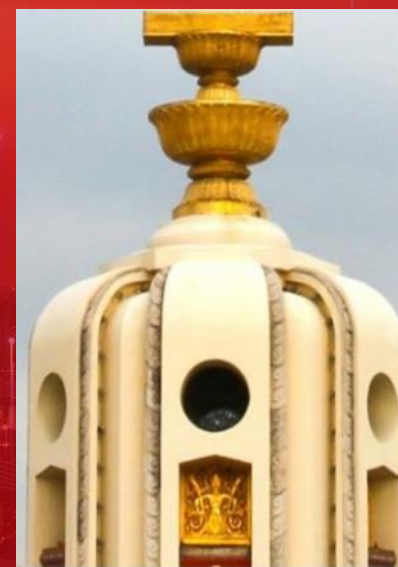
แก้ปัญหา รัฐธรรมนูญ