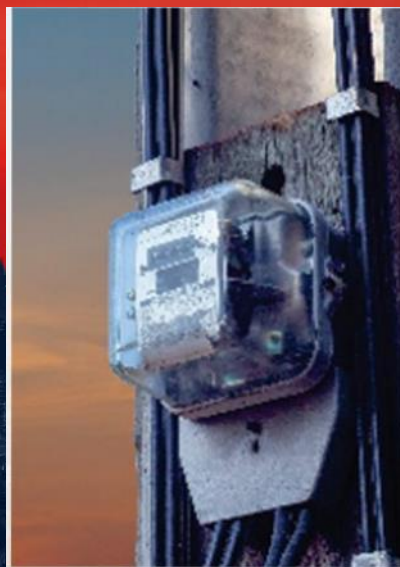
ลดภาระค่าใช้จ่าย ด้านพลังงาน