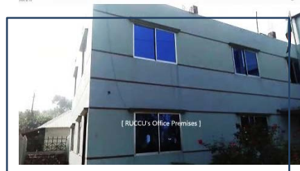
บริเวณภายนอกอาคารสำนักงานของสหกรณ์