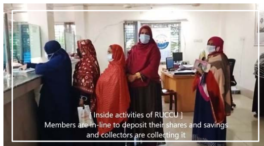
สมาชิกต่อแถวเพื่อชำระค่าหุ้นและนำเงินมาฝากกับสหกรณ์