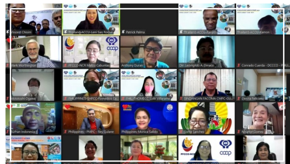
ผู้เข้าร่วมรับฟังการบรรยายผ่าน Zoom Meeting