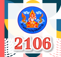
สหกรณ์เป้าหมายใช้งาน Smart4M เพื่อการสอบบัญชีระยะไกล (Remote Audit)